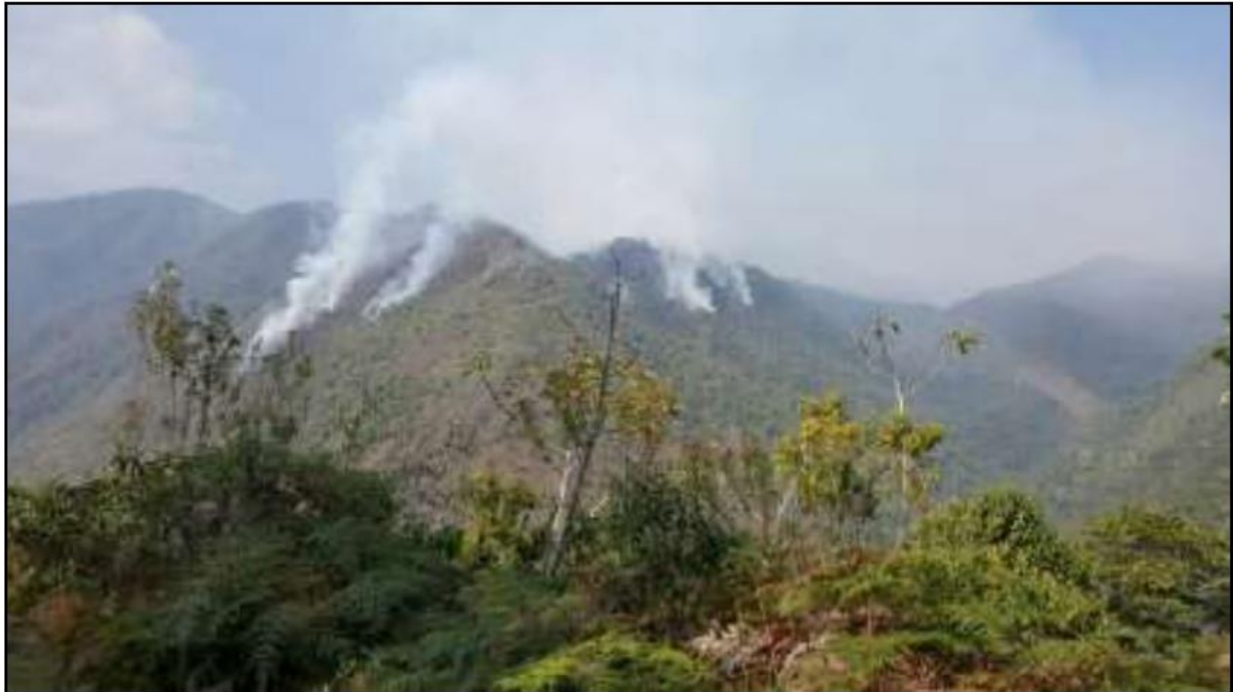
Incendio forestal en Chontabamba (Pasco)

CENTRO DE OPERACIONES DE EMERGENCIA NACIONAL