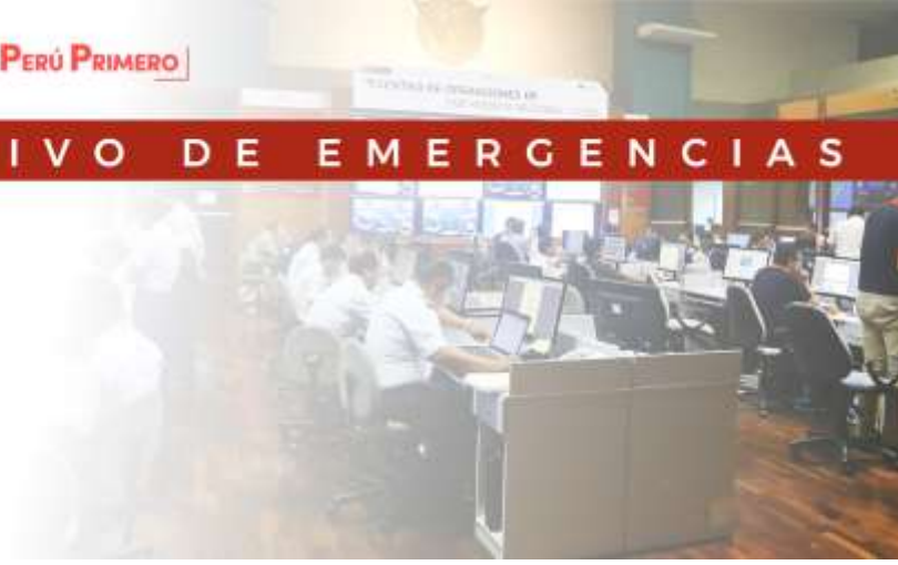
TEMPERATURA MINIMA DIARIA Fecha: 06 de Noviembre de 2018