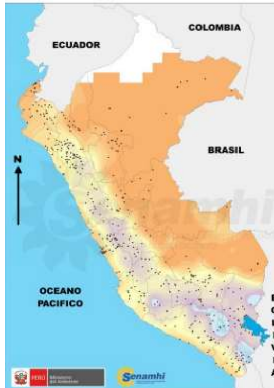
TEMPERATURA MINIMA DIARIA Fecha: 27 de Octubre de 2018.